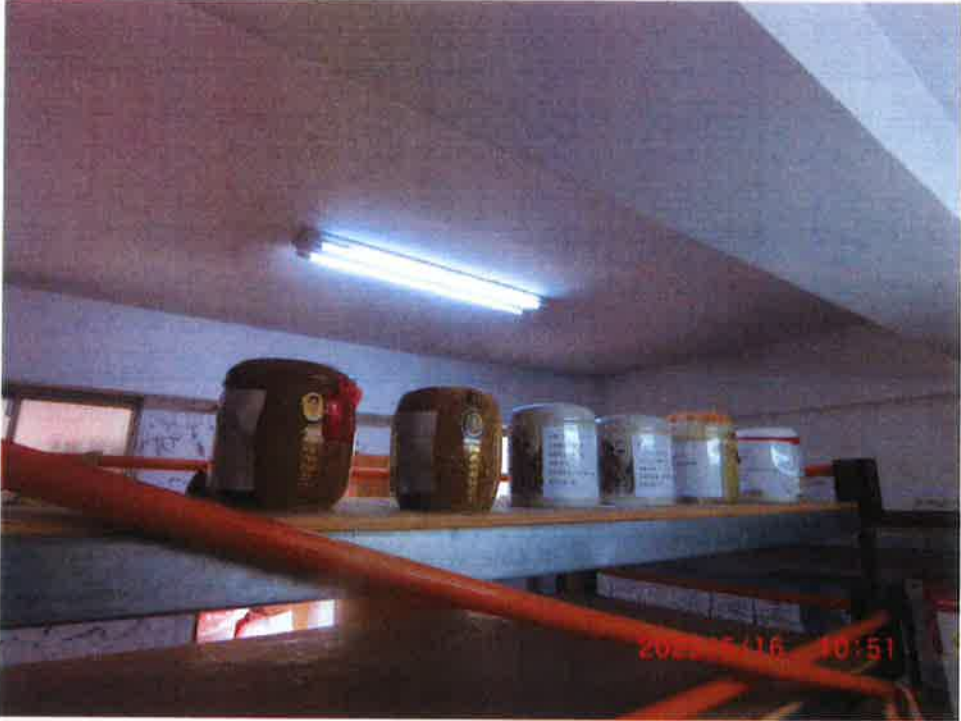
蘆竹生命紀念園區內無人認領之骨灰(骸)認領