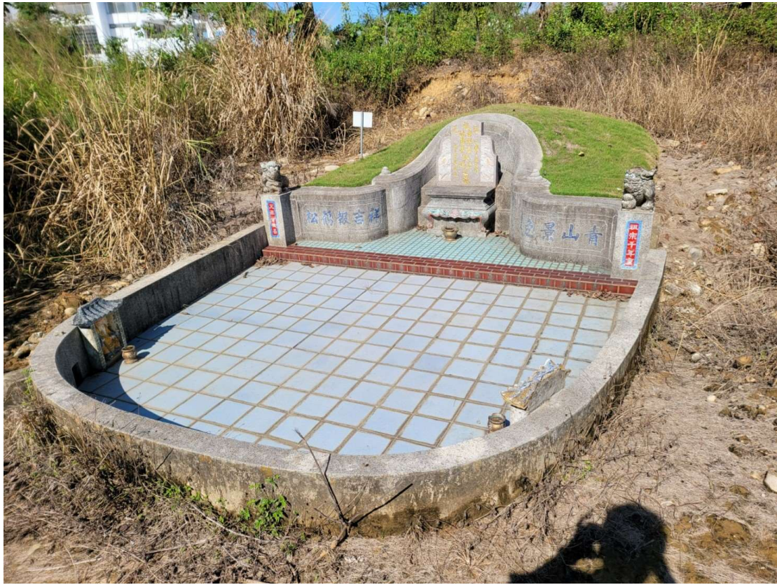
潭子區興龍段 0926-0000 地號上墳墓照片