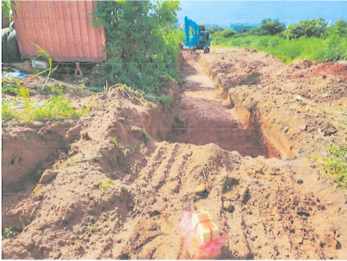
開挖遇無主墳墓工區