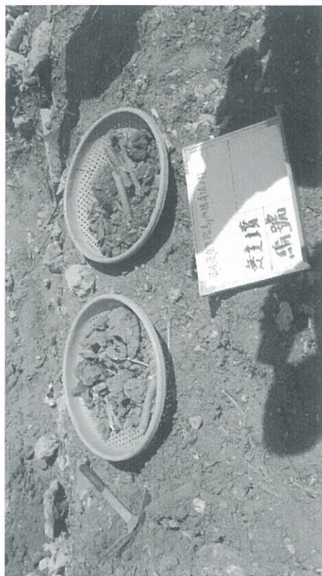
葬儀社處理情形一景