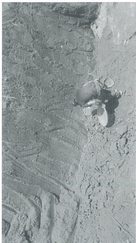
葬儀社處理情形一景