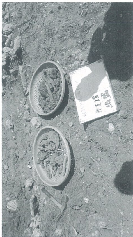
葬儀社處理情形一景